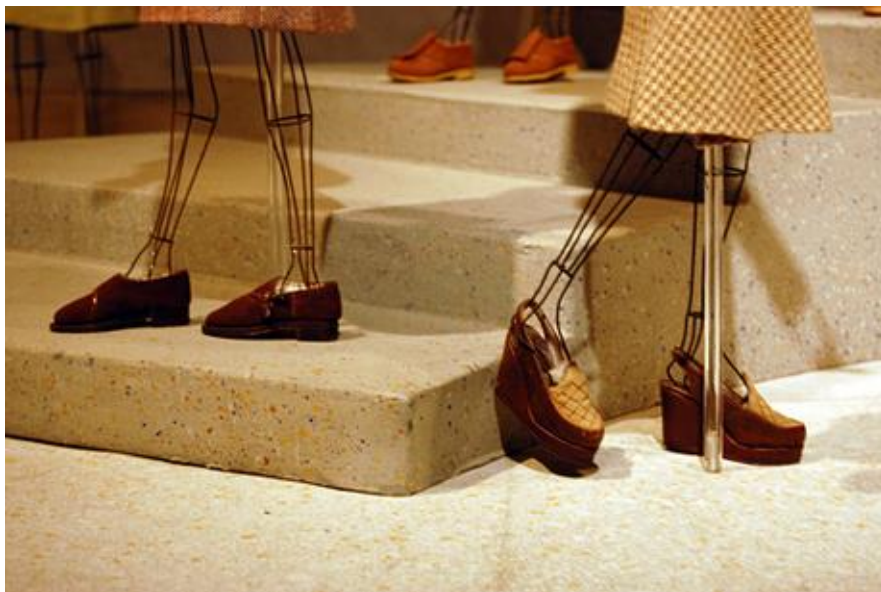
Рис. 3.1.2. Проект «Театр моди», фрагмент.