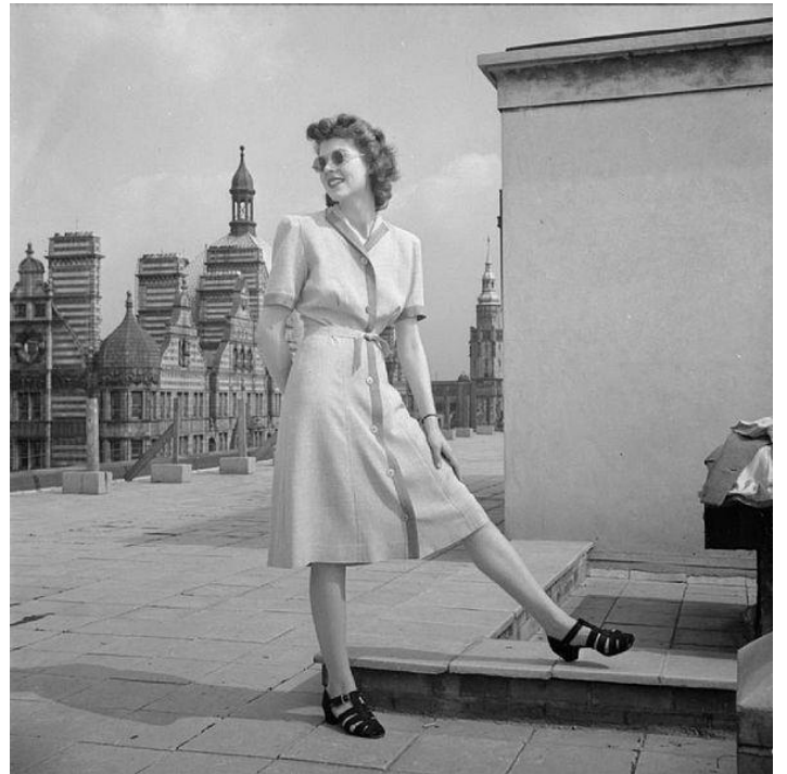
Рис. 2.1.5. Британський жіночий костюм періоду «Утиліті», 1943 р.