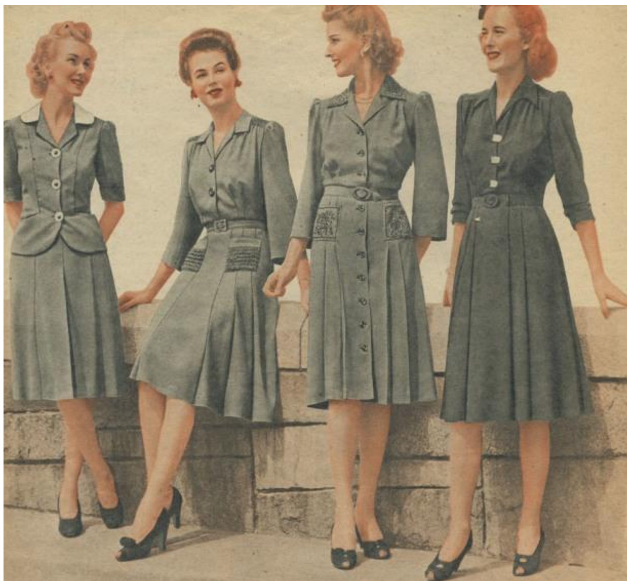
Рис. 2.1.1 Сукні у стилі «мілітарі»